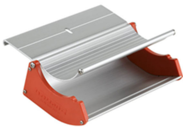
Beschichtungsrinne G-COAT 401