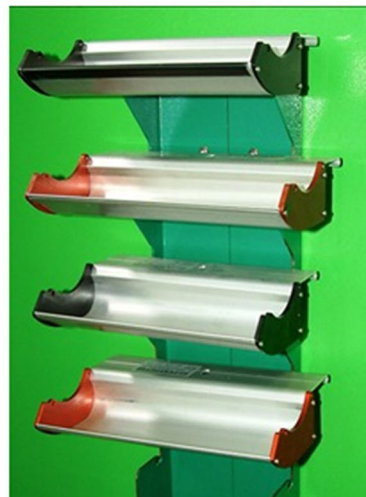
Regal zur Aufbewahrung der Rinnen