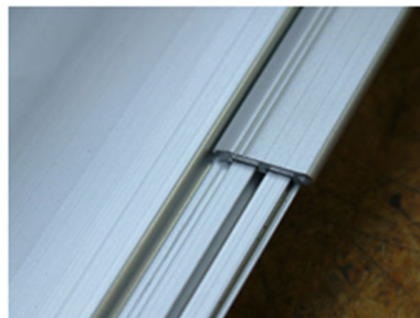
Einfacher Austausch der Ersatzkante