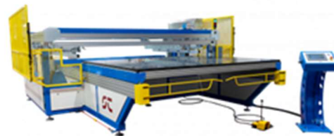
Flachbettmaschine - Modell S3 P (Seitenansicht)

Weitere Details finden Sie auf unserer Website: